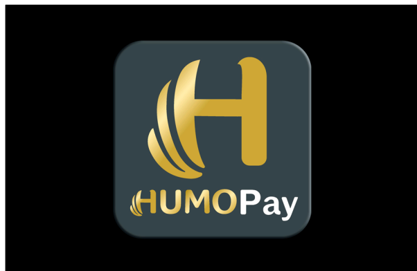
Размещение логотипа на чёрном фоне