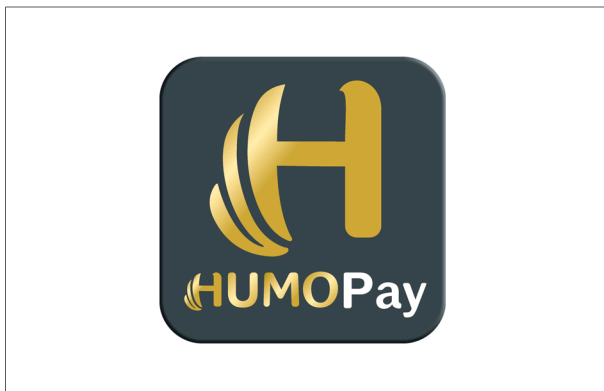
Размещение логотипа на белом фоне