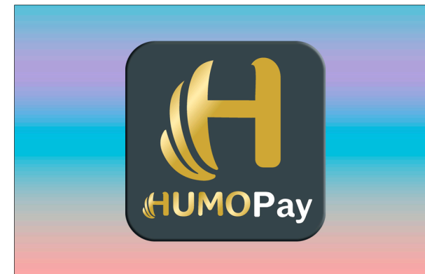
Размещение логотипа на цветных фонах