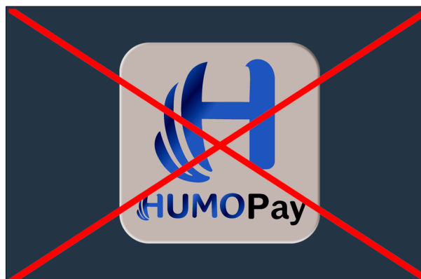
Недопустимо размещение логотипа на цветных фонах с инверсией цвета